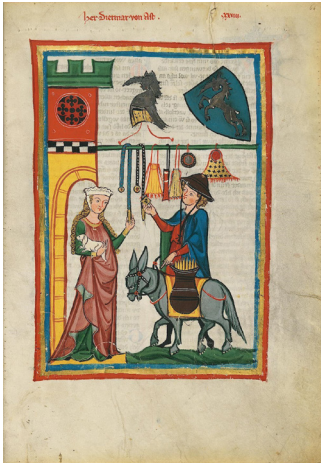
Abb. 2: Meister des Codex Manesse: Herr Dietmar von Aist, Große Heidelberger Liederhandschrift (Codex Manesse), ca. 1300/1340, 35 cm x 25 cm, Cod. Pal. Germ. 848, Heidelberg, Universitätsbibliothek, fol. 64r. CC-BY-SA 4.0.

von den faiseuses d'aumônières sarrazinoises im 13. und 14. Jahrhundert adaptiert und durch dekretierte Qualitätsstandards als modische Accessoires vor Ort verkauft sowie an höfische Kundschaft in West- und Mitteleuropa exportiert. 6 Nicht allein wegen des hohen Prestiges, das mit dem Besitz solcher Taschen einherging, sondern auch aufgrund der reichen Stickereien mit meist höfischen Motiven fungierten sie als Minnegeschenk. So ist etwa auf einer Miniatur im Codex Manesse der Minnesänger Dietmar von Aist dargestellt (Abb. 2), der als Händler von Taschen und Gürteln auftritt.