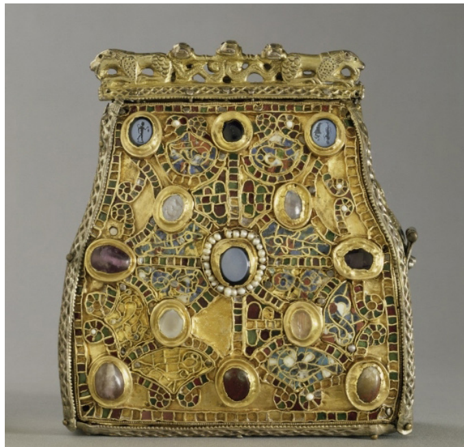
Abb. 6: Reliquiar in Bursenform aus dem Schatz des Stiftes St. Dionysius zu Enger/Herford, ca. 3. Viertel 8. Jahrhundert, 16 x 14 x 5,3 cm, Ident.Nr. 1888,632, Berlin, Kunstgewerbemuseum.

Nicht nur die praktischen Eigenschaften der Tasche sprechen für eine Umnutzung zum Reliquiar. Auch in Relation zur zielgerichteten Missionierung der Apostel bei Lukas 22,36 , als Attribut von Heiligen wie Nikolaus von Myra oder Johannes Eleemosynarius, als Metapher im Neuen Testament und Element in der Pilgertracht tritt sie in Erscheinung. Ihre vieldeutige Form wurde bereits zur Zeit der frühen Reliquienverehrung als Vorbild für die Gestaltung von Reliquiaren genutzt. Die im Goldschmiedehandwerk ausgeführten Bursenreliquiare, in den Inventaren als capsa bezeichnet, waren insbesondere ab dem 7. bis ins 12. Jahrhundert weit verbreitet. 15 Es handelt sich dabei um kleine Behältnisse mit hölzernem Kern, geschmückt mit applizierten Gemmen, Emails und figuralen sowie ornamentalen Reliefs in Gold, welche dem Erscheinungsbild einer Tasche angeglichen wurden. Diese harten, meist fest verschlossenen Objekte sind auf haptischer Ebene kaum mit den weichen, flexiblen Taschen zu vergleichen und bilden wie etwa das Engerer Reliquiar in Bursenform (Abb. 6) geradezu eine Einheit mit dem Innenliegenden.