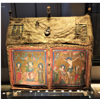
Abb. 7: Reliquienkästchen mit eingesetztem Altärchen, Anfang 14. Jahrhundert, Stoffe: verschiedene Provenienzen, um 1300–1330, 31 cm hoch, 35,5 cm breit, 16 cm tief, Holz, Textil, Pergament, Bergkristall, Korallenperlen, Regensburg, Domschatz, Ident.Nr. D 1974/66.

Obwohl das Xantener Stück nicht aus glänzendem Gold gefertigt ist, hat das Material der Tasche eine besondere Relevanz in seiner neuen Funktion. Bevor die Schau der Gebeine in Reliquiaren ab dem 13. Jahrhundert im Westen zunahm, wurden Knochenreliquien grundsätzlich fest in edle Stoffe eingenäht. Dafür schnitt man Textilien – für gewöhnlich liturgische Paramente in Zweitverwendung – so zu, dass besondere Webtechnik, Motive oder Materialien wie Goldfäden von außen sichtbar waren, um anschließend das ungesäumte Textil mit den offenen Schnittkanten nach innen zu vernähen. 16 Bereits der Kirchenvater Hieronymus nannte in seiner Schrift Contra Vigilantium unter den zwei Arten der Reliquienverhüllung den Stoff ( linreamen ) und das Gefäß ( vasculum ). 17 Aus diesen beiden Elementen ergab sich die übernommene Struktur der Reliquienaufbewahrung, die parallel zur Beisetzung eines Toten folgendermaßen gestaltet ist: Das Kernstück bildet die Reliquie (Leichnam), welche in einen Stoff geschlagen (Leichentuch) in ein stabiles, schützendes Gefäß (Sarkophag) gebettet wurde. Diese Grenzziehung zwischen linreamen und vasculum wird im Fall der Xantener aumônière diffus: In oppositärer Weise verhüllt der Stoff schützend und enganliegend das Fragment, vermittelt jedoch andererseits durch seine prächtige Ausgestaltung in der Art eines textilen Reliquiars die Heiligkeit seines unansehnlichen und unsichtbaren Inneren. 18