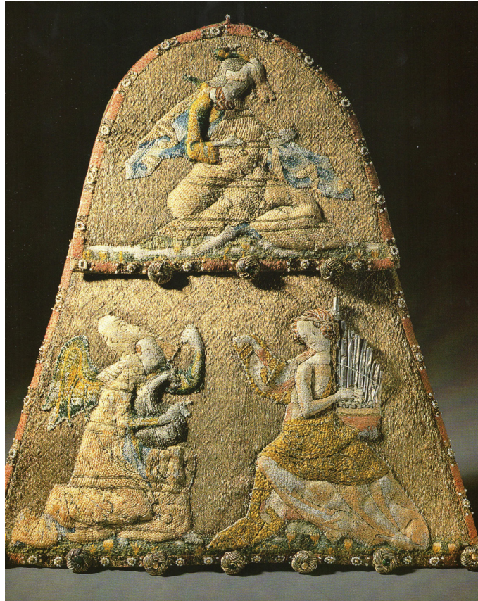
Abb. 1: Almosentsche, um 1340/50, 35 x 31 cm, Seide auf Leinwandstoff, Stickerei, Reliefunterpolsterung aus Rohbaumwolle, Golddraht, Metall, Perlen, Glassteine, Paris (?), heute Xanten, StiftsMuseum, Inv.-Nr. I 80. Abbildung aus: Grote, Udo: Der Schatz von St. Viktor. Mittelalterliche Kostbarkeiten aus dem Xantener Dom, Regensburg 1998, S. 121. © Schnell & Steiner.

Solch ein kostbares Exemplar aus Seide, durchwirkt mit Goldfäden und bestickt mit differenziert gestalteten Musikanten wird im StiftsMuseum Xanten verwahrt (Abb. 1). 3