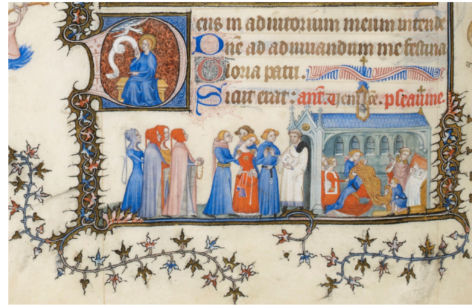
Abb. 3: Das Sakrament der Ehe, Les Très Belles Heures de Notre-Dame , um 1380 (fertiggestellt Anfang 15. Jahrhundert), Paris, Bibliothèque Nationale de France, fol. 175v, Detail. Licence EtaLab .

Auch die Xantener Almosentasche bot für wandernde Finger eine unebene Oberfläche durch die applizierten Figuren; die Perlen an der Borte und die aufgenähten Zierknöpfe stellten eine abwechslungsreiche Materialstruktur bereit und erlaubten das Ertasten der und Spielen mit den Ornamenten.