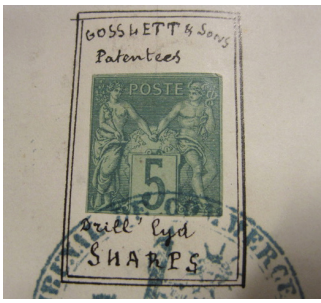
Abb. 1: INPI 1MA5, No. 34037 [21.03.1879], Detailansicht.

Unter letzterem kann man sich kleine Bohraufsätze vorstellen. Ersteres ist etwas irreführend, denn der Eintrag stammt nicht von einer Firma mit diesem Namen, sondern von der Gesellschaft Gossioûme père, fils & cie., die in Paris ein Merceriegeschäft betrieb. 2 Sie war am fraglichen Tag auf dem Gericht vorstellig geworden, um eine Handelsmarke zu registrieren. Zumindest war dies die erklärte Absicht, in der die Angelegenheit auch allererst aktenkundig wurde. Zum Zweck einer solchen Registrierung war den Behörden ein Modell der Marke verfügbar zu machen, das sodann im Rahmen eines niederschweligen Verfahrens (procès-verbal) in eine Formularstruktur integriert und zur weiteren Aufbewahrung ins Coservatoire des Arts et Métiers weitergeleitet wurde. Auch im vorliegenden Fall hatte dieser Prozess seinen gewohnten Gang genommen bis hin zu der Erklärung, mit der der Depositeur zu Verstehen gab, sein kleines Kunstwerk einem Eigentumsanspruch zu unterstellen: «Nous soussignés, Gossioûme père, fils & cie. [...] nous réservons la propriété de cette marque et le droit de la reproduire dans tous les formats et tous les coloris.» 3