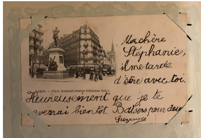
Abb. 6: Karte von Suzanne an Stéphanie, 12. Mai 1903.

Während kürzerer Reisen solange das Dienstverhältnis als Kindermädchen währte, in der Zeit in Südfrankreich und dann über die Jahre der räumlichen Trennung hinweg, hielt Familie Schlüssel das Verhältnis zu Stéphanie aufrecht, vor allem die Kinder schreiben immer wieder. Die Karten der kleinen Suzanne zeugen von der grossen Zuneigung, die zwischen ihnen herrschte (Abb. 6).