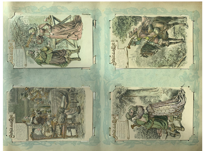
Abb. 1, 2: Umschlag und erste Postkartenseite des Albums.

Im Postkartenalbum gesammelt finden sich Festtagsgrusskarten (vor allem Neujahrskarten), Karten der Geschwister (vor allem der Brüder) mit Familiennachrichten aus Kehl, Karlsruhe, Heidelberg, Thun, Zaragossa, ..., Kartengrüße von Freund:innen, Bekannten, Kollegen und ehemaligen Schülern sowie Sammelpostkarten unterschiedlichster Couleur. Grusskarten der Mitglieder der Familie Schlüssel und liebevolle Botschaften zwischen