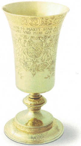
Abb. 3: Theodor Merian: Pokal, Silber (teilweise vergoldet), 1550/60, Historisches Museum Basel, 1946.173.

spielerisch-andeutungsvolle, zuweilen ermahrend-einschränkende Weise zur Sprache gebracht wurden.