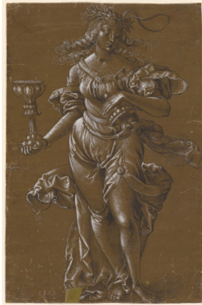
Abb. 2: Hans Baldung gen. Grien: Allegorische Frauengestalt, einen Pokal haltend (Fortuna?), 1519, Feder und Pinsel in Schwarz, weiss gehöht, auf braun grundiertem Papier, 32 x 21.1 cm, Kunstmuseum Basel, Kupferstichkabinett, Museum Faesch 1823, Bildquelle .

Die andeutungsreiche Symbolik der Scheibe ist bemerkenswert, gehörte doch der Stifter zum engsten politischen Führungszirkel der Stadt: Seit 1580 Mitglied des Kleinen Rates, übernahm Merian verschiedene städtische Ämter, im städtischen Territorium vertrat er die Basler als Deputat der Kirchen und Schulen und in der Eidgenossenschaft als ennetbirgischer Gesandter. 8 Wenn Merian im Untertanengebiet der Stadt, zu dem auch Liesental gehörte, eine Scheibe stiftete, tat er dies also nicht zuletzt auch als Vertreter der städtischen Obrigkeit, die sich selbst seit der Reformation als res publica christiana repräsentierte und in ihren gedruckten Mandaten die Ehe als einzig legitimen Ort der Sexualität propagierte – dies umso mehr, als Merian ab 1591 für drei Jahre als Richter am Basler Ehegericht geamtet hatte. Wie ist eine Wappenscheibe zu verstehen, die auf den ersten Blick so gar nicht zur reformatorischen Sexualmoral zu passen scheint? Einen ersten möglichen Erklärungsansatz bietet das Gebäude, an das sich die Stiftung Merians richtete: Schützenhäuser waren im 16. Jahrhundert Schauplätze einer männlich konnotierten, mitunter gewalttätigen und sexuell aufgeladenen Rivalitätskultur. Die dort stattfindenden Handlungen wie das Schiessen selbst, aber auch Spielen und Alkoholkonsum wurden von den städtischen Regierungen bis zu einem gewissen Grad