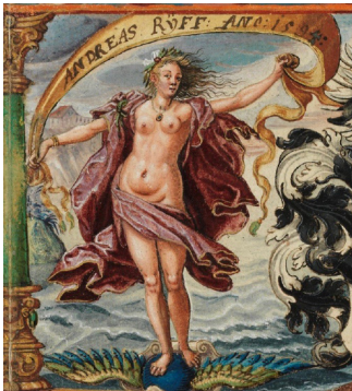
Abb. 4: Hieronymus Vischer: Fortuna, 1594, in: Münz- und Mineralienbuch des Andreas Ryff, Universitätsbibliothek Basel, A lambda II 46a.

Bezieht man die Bedeutungsaufladung der Goldschmiedekunst im späteren 16. Jahrhundert mit ein, eröffnet sich wiederum ein neuer Blick auf die Frauenfigur in Merians Scheibe. Dies insbesondere deshalb, weil die Allegorie der Fortuna seit ungefähr 1500 eine Umdeutung erfuhr: Neben dem Verweis auf das zyklische Auf und Ab des Schicksals akzentuierte sich ihre Symbolik während des 16. Jahrhunderts zunehmend auf den Bereich von ökonomischem Wagnis und Risiko. Besonders in Gestalt der Fortuna Maris, ausgerüstet mit Segel und umgeben von Wasser auf einer Kugel balancierend, vermochte sie einerseits als Zeichen für die Hoffnung auf rasch erworbenen Reichtum zu fungieren, andererseits aber, verdichtet im zeitgenössisch besonders intensiv adressierten Bild des Schiffbruchs, auch als Mahnung für das stets mögliche Scheitern. In dieser Ambivalenz fand die Fortuna auch Eingang in das 1594 entstandene Münz- und Mineralienbuch des Basler Kaufmanns und Bergwerkunternehmers Andreas Ryff, indem die vom Seehandel inspirierte Meeresfortuna auf die Unsicherheiten und Risiken des Bergbaus übertragen wurde 17 (Abb. 4).