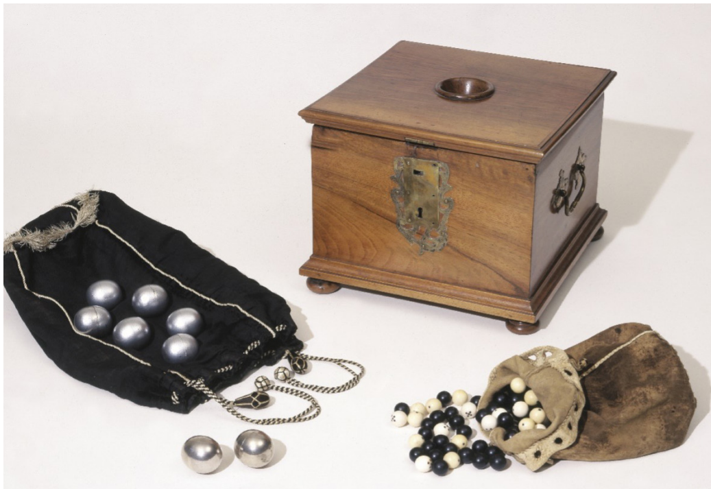
Abbildung 1: Historisches Museum Basel, Foto: M. Babey.

«Umb diese zeit ware das practicien, spendieren, rennen und laufen umb alle ämbter im höchsten grad, und respectirte man weder unseren herr Gott, weder unser geistlichen, weder die obrigkeiten noch den tewren eyd.»