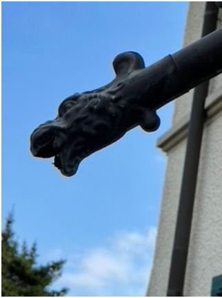
Abb. 1: Spuren des Sturmdrachsens in einer westlichen Dekoration