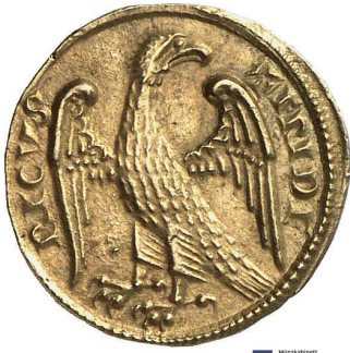
Abb. 2: Goldaugustale Friedrichs II., 1231–1250, Münzkabinett der Staatlichen Museen zu Berlin, Objektnr. 18205662 .

In der außerordentlich dichten Reihe normannischer Adlerdarstellungen an Sakralgeräten, Kreuzgängen und Evangelienpulten findet sich für diesen Adlertypus kein Äquivalent. Allein der berühmte Goldaugustale Friedrichs entspricht diesem Adlertypus (Abb. 2). 15