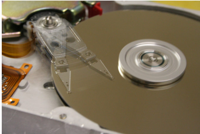
Abb. 2: «Hard Disk» von Alpha six, lizenziert unter CC BY-SA 2.0 .

Überreste aus dem Kreislauf ausscheiden müssen und Rohstoffe ritualartig zerstört und verbrannt werden. 15